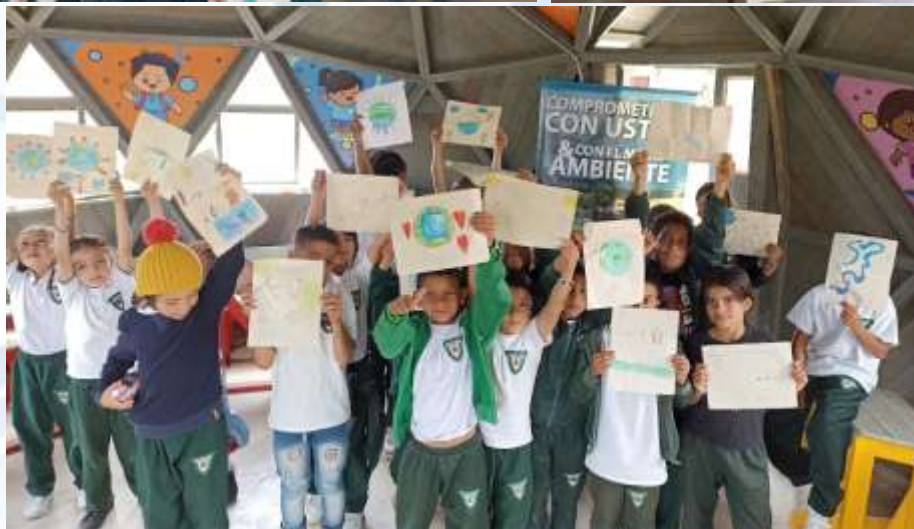
Campañas de sensibilización ambiental (I.E. Francisco Mansueto Giraldo)