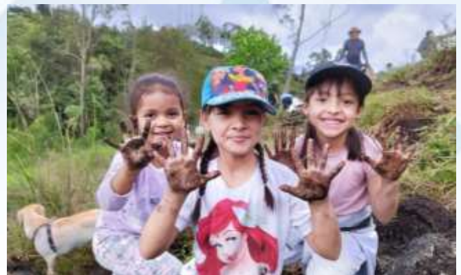
Siembra de árboles con Coopimar (noviembre de 2023)