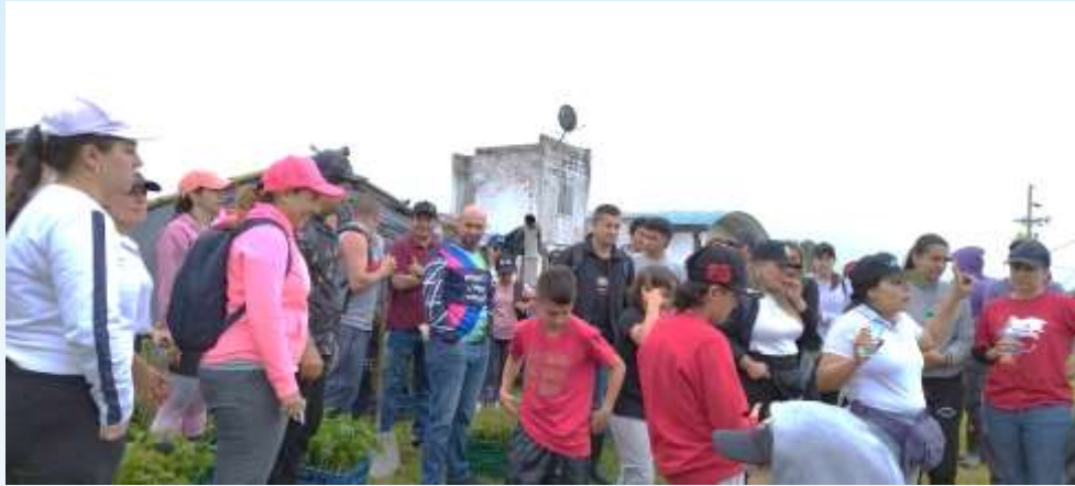
Siembra árboles con Griffith Foods SAS (Octubre 2023)